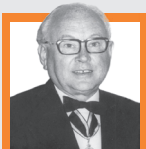
Prof. Dr.-med. Dr.-med. h.c. mult. Gerd Meyer-Schwickerath